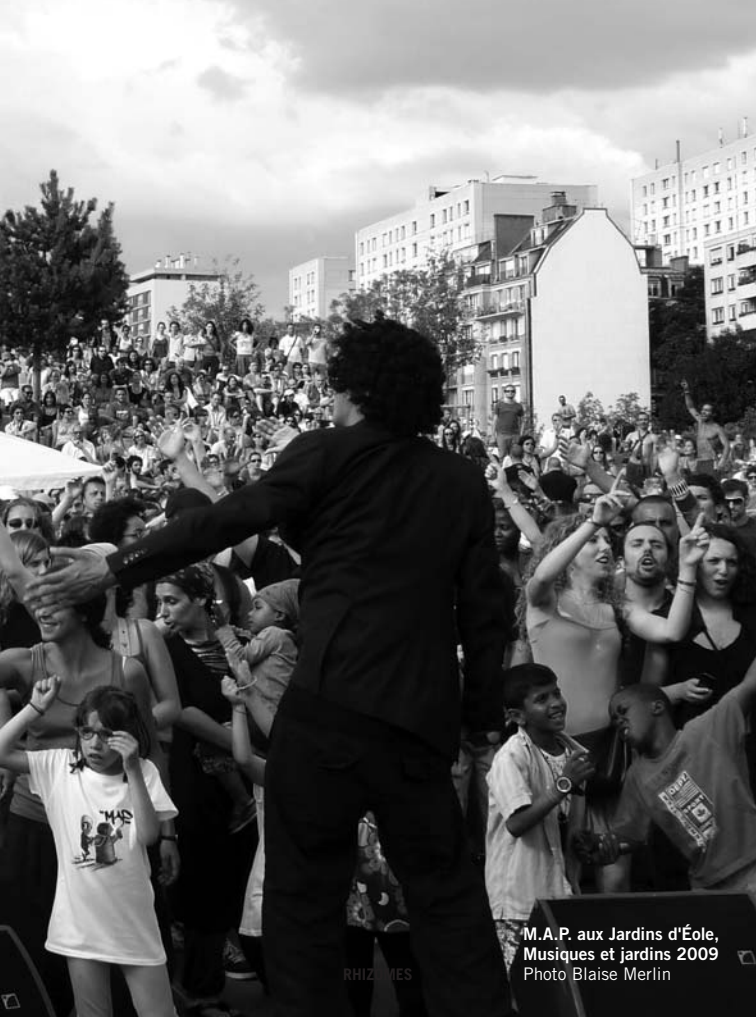
M.A.P. aux Jardins d'Éole, Musiques et jardins 2009